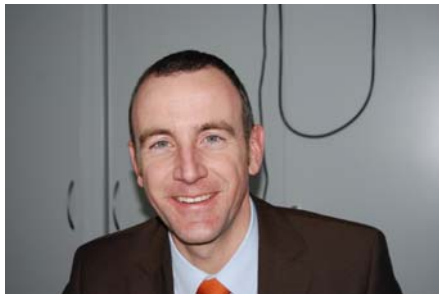
EMH Energie- Messtechnik GmbH