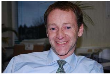
SCAN COIN – PERCONTA GmbH